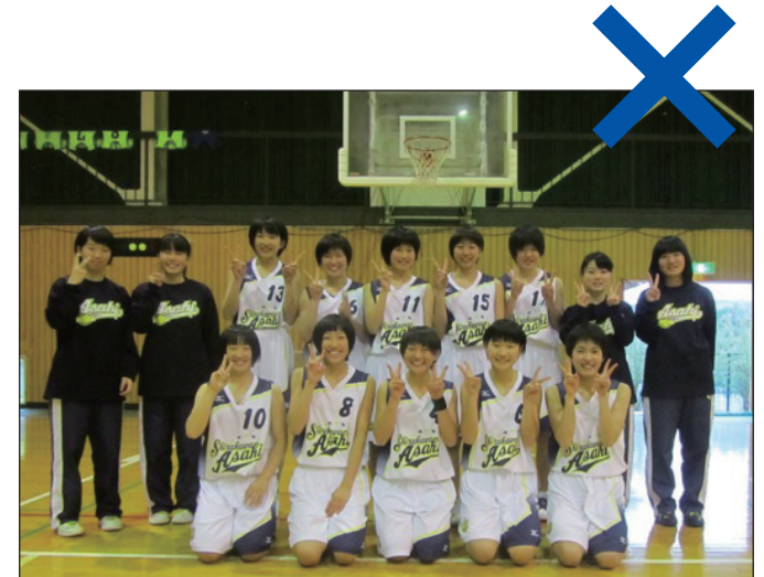
横に広がって入ってしまうと縮小せざるを得ないので、肝心の選手の写真が小さくなってしまいます。