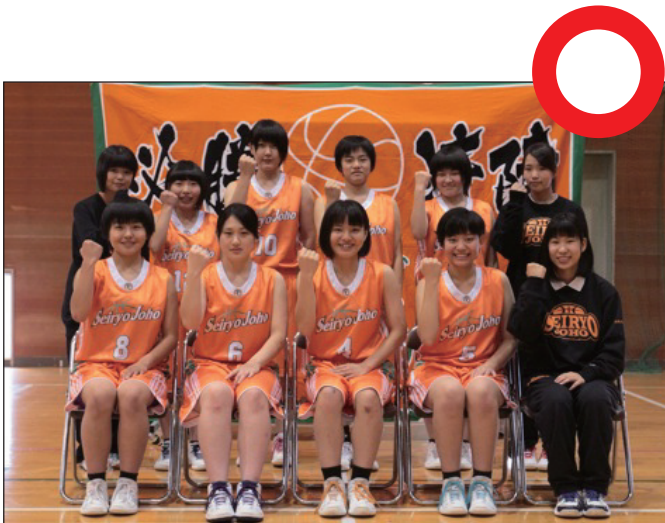
選手たちを中央に配置し、全員が無理なく枠内に収まっています。

一生懸命練習してきた選手の晴れ舞台ですので、できるだけ良い写真を掲載したく、ご協力の程お願い致します。