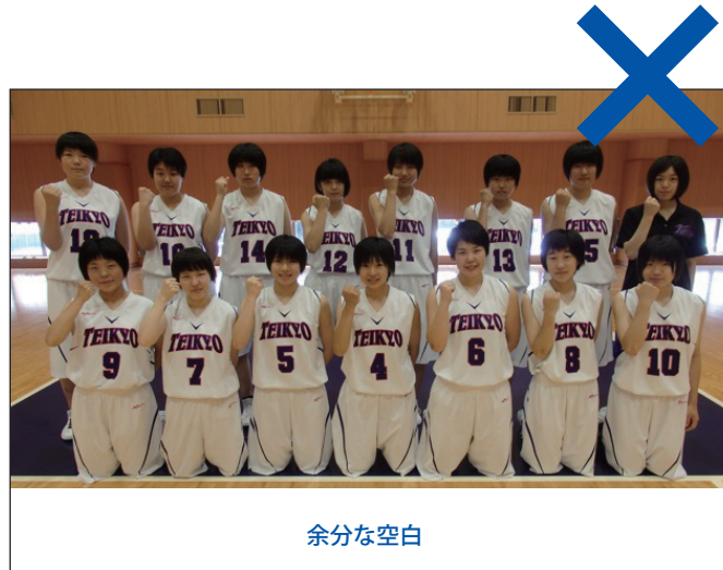
写真の縦横に合わせてギリギリまで大きく撮影されていますが余白が少ないため、トリミングで枠内にびったり収まりません。